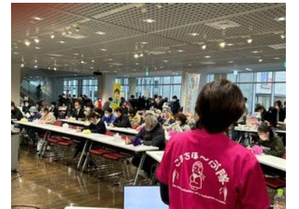
2023年11月11日 心いきいき芸術祭での様子②