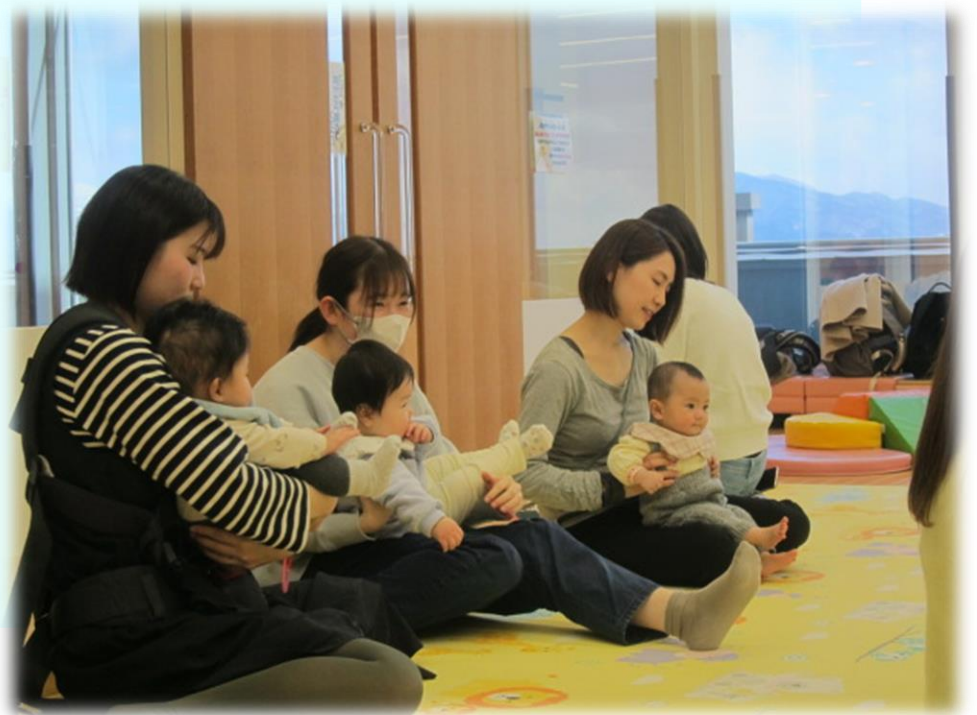
季節の歌「ひなまつり」を 歌いました。