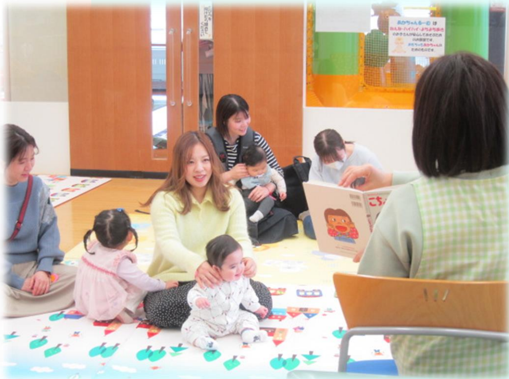
絵本「こちょこちょあそび」