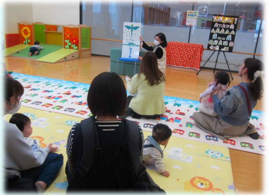
大型絵本「ぴょーん」