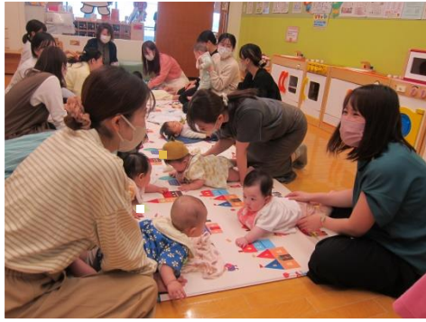
保護者同士のおしゃべりタイム！