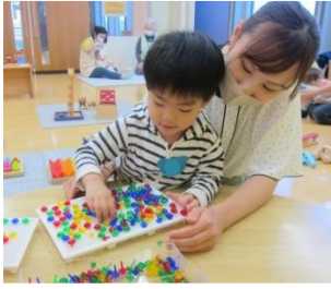
さまざまな色や形の、木のおもちゃで遊びました！