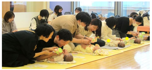
紙コップとストローを使って、製作遊び「げこげこがえる」音を聞かせたり追視をしたり・・・