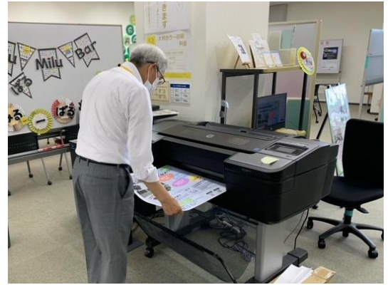
大型プリンター使用中の様子

※用紙サイズがA1ロール紙なので、垂れ幕・横断幕は、A1を基準に長さに応じた金額となります。