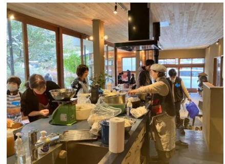
2022.12 みそづくりの様子

子どもではなく、大人が楽しみながら活動することを一番に考えています。大人が楽しんで笑っている姿や空気を感じてもらうと、自然と子ども達にとっての安心空間が作られるからです。子ども達が安心していられる場所として、子どもは何をしていますがいても良い！無理強いはいらない！をモットーに活動しています。