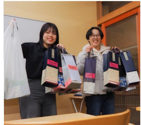
生理用品配布の準備の様子

11月10日の13:00～17:00に文化創造館にて「生理万博」というイベントを開催いたします！留学生や留学経験者を招き、展示やインタビュー、座談会を行います。生理についてや国際交流にご興味のある方はぜひお越しください！