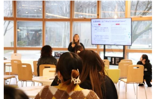
「生理のあいう」というイベントの様子

SRHR(性と生殖に関する健康と権利)というテーマの認識向上を目指し、国際教養大学のキャンパス内での生理用品の配布、イベントの実施、SNSを通じた情報発信を行っています。