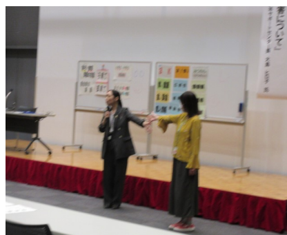
少年の指導における適切な距離

また、「秋田には、「秋田駅界限」と自分たちを呼ぶ若者集団のようなものがあり、「大館駅界限」などの子たちが秋田駅に来て名前も分からない者同士が、知り合いになって、不良行為などを行っています」とのことでした。