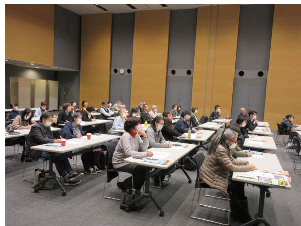
講演をきく少年指導委員の様子

他にも、最近の若者たちが日常的に口にしている言葉を問題形式で教えてください、「ハムト」は「公共トイレ」や「り」は「了解」など普段ききなれない言葉に驚きました。