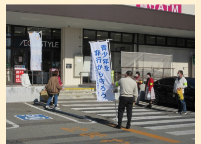
東部少年指導委員会から、お写真をいただきました！