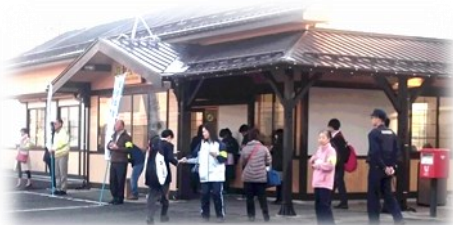
11月2日 西部地区 新屋駅