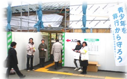
11月13日 北部地区 追分駅